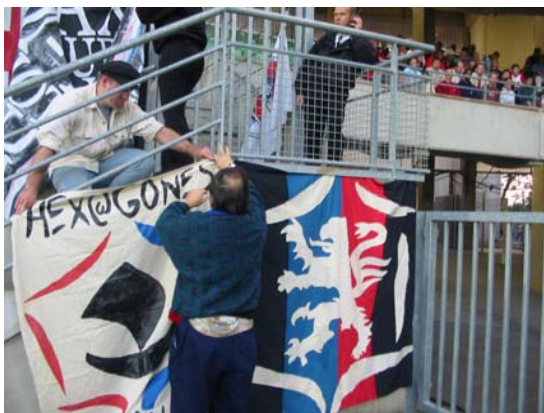
Rennes-OL : bâchage à l'ancienne par Titouplin et Jacquot

Ain-Rhône- Isère Floriane [rhonealpes@hexagones.org] Ile de France Jacquot [rs75@hexagones.org] Drôme-Ardèche-Midi Greg [rs07@hexagones.org] Ouest Delf, Nelly [rsatlantique@hexagones.org] Nord, Est, Etranger Zoltan [rsnordest@hexagones.org] Adhésion Laurence [lolotte@hexagones.org] Redaction Cyrille [cyrille@hexagones.org]