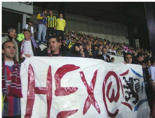
D'Arsenal (2001) à Istanbul 2004, la carte s'étoffe...

Le Grand Chelem tient toujours : un Gone à Prague et quatre à Istanbul. C'est peu, mais c'est assez pour être dans la course ! Ah, les matchs en semaine... A cette heure, les héros fatigués n'ont pas encore livré de compte-rendu, mais ça viendra ! A suivre sur le site.