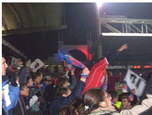
Bientôt de nouvelles scènes de joie en C1 ?

Ain-Rhône- Isère Floriane rs69@hexagones.org Ile de France Jacquot rs75@hexagones.org Drôme-Ardèche-Midi Greg rssidest@hexagones.org Ouest Delf, Nelly rsatlantique@hexagones.org Nord, Est, Etranger Zoltan rsrdm@hexagones.org Adhésion Laurence lolotte@hexagones.org Redaction Cyrille cyrille@hexagones.org