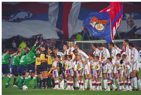
2000-2001, dernier derby à ce jour en Championnat

La date exacte du derby – théoriquement le 2 octobre – n'est pas encore fixée, espérons que la Ligue ne retiendra pas le vendredi ! Pour cet événement mythique et... de plus en plus rare, les Hex@ envisagent un déplacement en bus au départ de Lyon. La date risque évidemment d'influer sur la faisabilité ! A suivre prochainement sur notre site et forum...