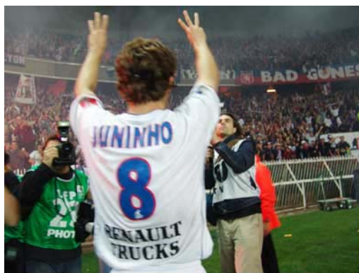
Tri-campeao ! (olweb.fr)

*Séverine ne souhaite pas conserver son poste en 2005. Cependant elle l'assure par intérim en attendant la nomination du nouveau RS.