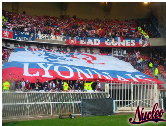
PSG-OL : tifo des groupes du VS

Chacun n'a pas forcément de temps à offrir, et il ne s'agit ici de culpabiliser personne, mais de rappeler que nous manquons de forces vives, sans doute au point de devoir réduire nos activités, si rien ne change.