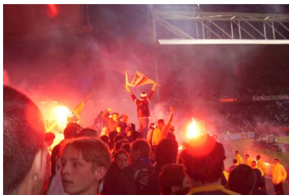
Et 3-0 !

Lyonnais d'ici ou d'ailleurs, fiers de nos couleurs