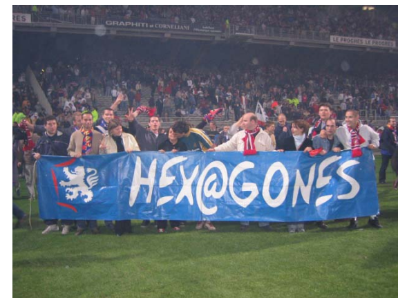
Numéro 27 du 17 juin 2004

Lettre d'information des supporters lyonnais d'ici et d'ailleurs