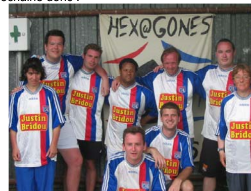
Fiers de nos couleurs

Peut-être perturbés par l'horaire, la formule, ou « le manque de blondes à la buvette » @Rayls, nos Gones ont terminé 11es sur 12 ! Mais plus que jamais l'essentiel était de participer : à l'année prochaine donc !