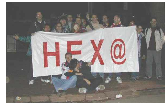
Après LOSC-OL 2001-2002... "Et on sera jamais champion !"

Et bien, ce n'est même pas sûr ! Car comme je vous le disais en en-tête, Aire est une équipe de Promotion d'Honneur, et son terrain est en synthétique... en tout cas, tout sauf homologué 1/32es de la Coupe. Rien n'est à ce jour décidé pour la réception de l'OL, mais Grimonprez-Jooris tiendrait la corde ; l'occasion pour nos Gones d'un dernier retour gagnant avant la rénovation du vieux stade.