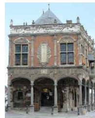
Aire : Le baillage

Last but not least, Aire possède une Association des Amis de la Bière !