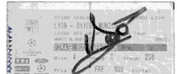
....Et c'est signé Govou !