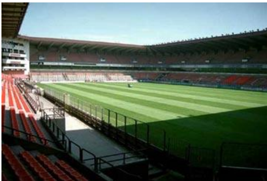
Les Hexagones seront à Bruxelles.....

Je pense que tout peut arriver dans ce groupe, le Bayern part grand favori mais ils peuvent très bien se retrouver derniers comme l'année passée. Pour les 3 autres équipes, le Celtic et Lyon sont un cran au dessus d'Anderlecht sur le papier...mais en coupe d'Europe tout peut arriver.