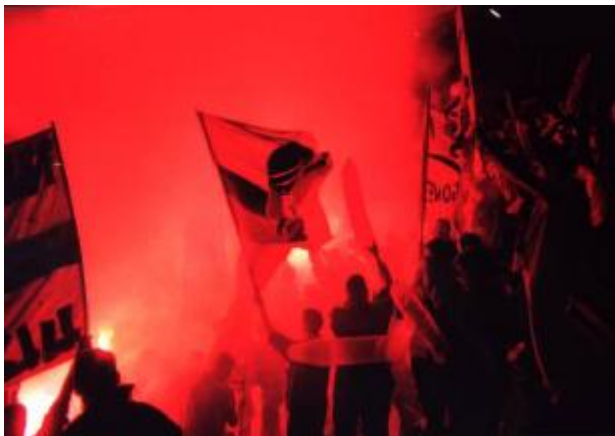
Ligue des champions 2002-2003 : Inter-Lyon...