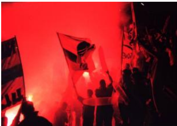
Ligue des champions 2002-2003 : Inter-Lyon...