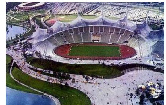
...et à Munich...Et vous ?